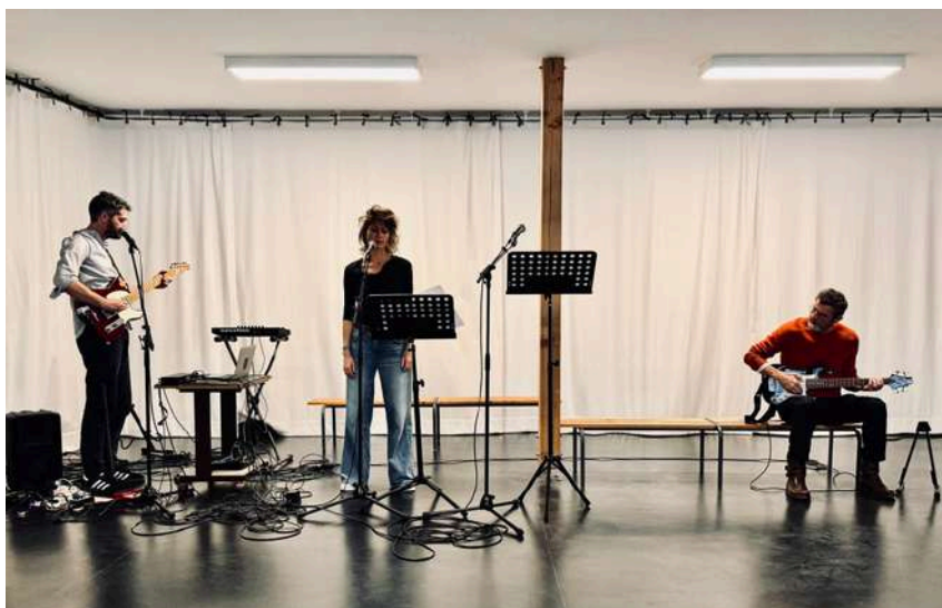
Résidence décembre 2025 . Le Grand Bleu . Lille

namercaroline@gmail.com - 06 10 07 03 70