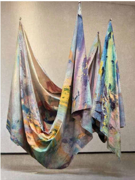
Oeuvre de Sam Gilliam