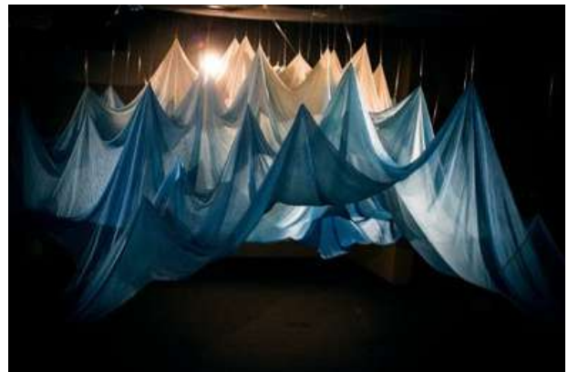
Installation Abbie Powers