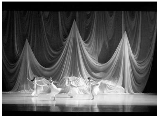
Scénographie de Michelle Jank