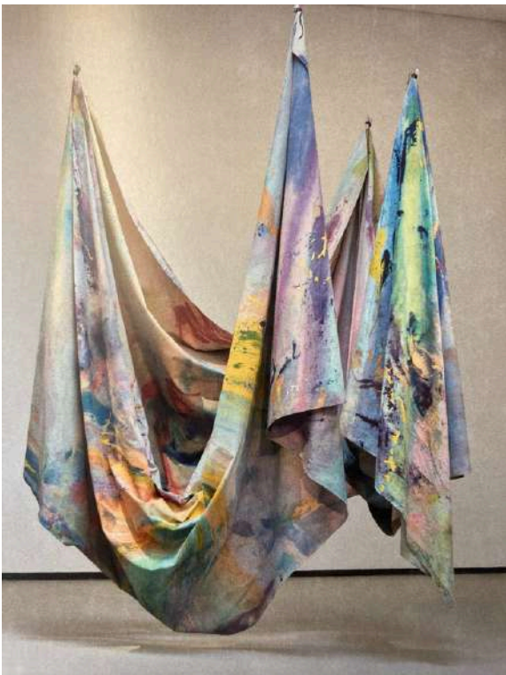
Oeuvre de Sam Gilliam