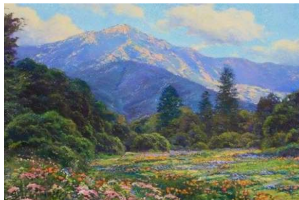
Toile de Dirck Foslien