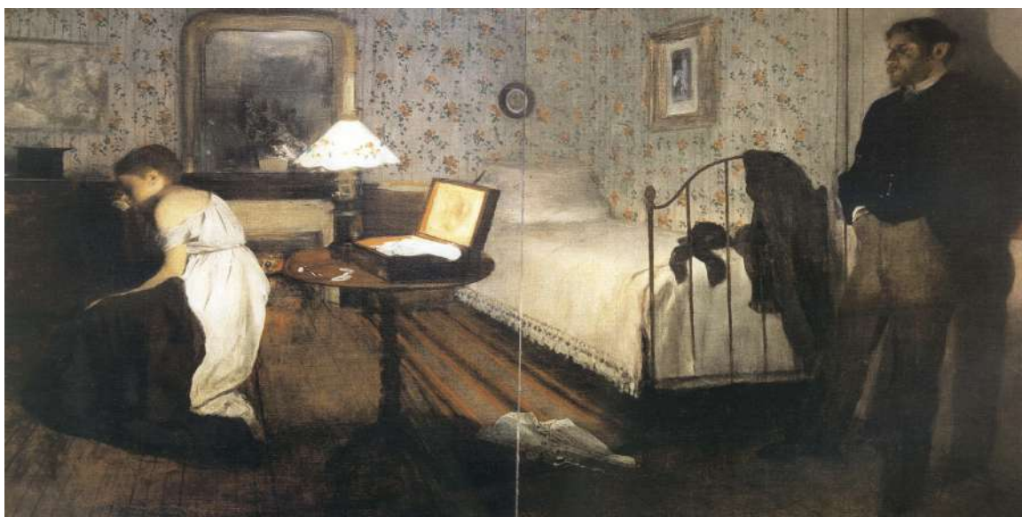
Intérieur, dit Le viol - Edgar Degas

OCTAVE - Ne vous inquiétez pas. J'inventerai une histoire. Campardon ne nous mangera pas !